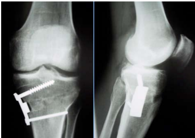
Figura 1 – Osteotomia medial em cunha de abertura fixada com placa de Puddu.